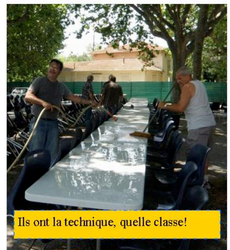
Ils ont la technique, quelle classe!