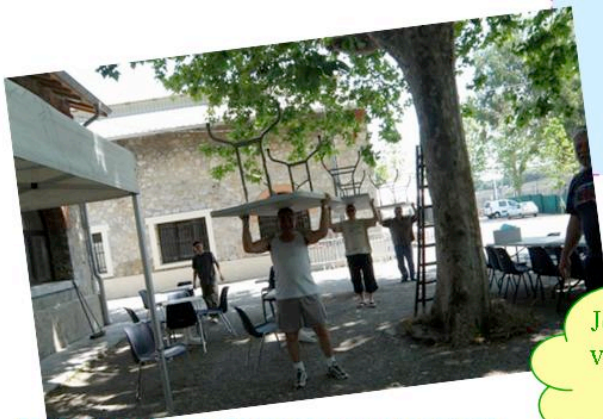
Sans les casques...ils ont la tête dure