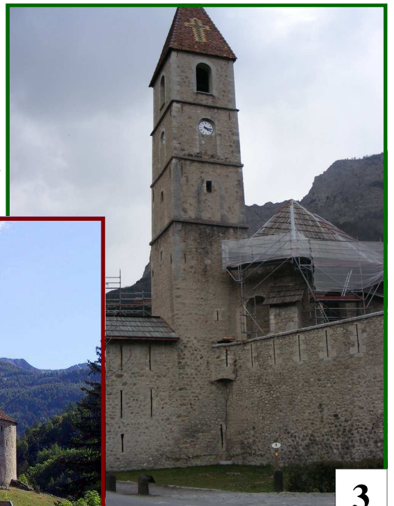
Je suis : COLMARS les ALPES